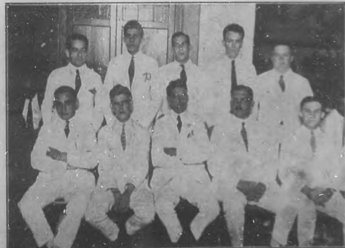
LA DIRECTIVA DEL CLUB "SAN CARLOS".—Personas que forman la directiva del Club "San Carlos", progresista sociedad, que en su último baile conquistó un rotundo triunfo.

Causas involuntarias han impedido que se realizara en la forma resultaba primeramente; pero esa circunstancia satisficó a las muchas personas que han tomado localidades para un beneficio tan justificado, porque ahora ha determinado la Comisión que se verifique el Concierto en el hermoso salón de actos del Conservatorio Falcón, cedido por el eminente pianista cubano con un desprendimiento y un desinterés que mucho agradece nuestro compa-